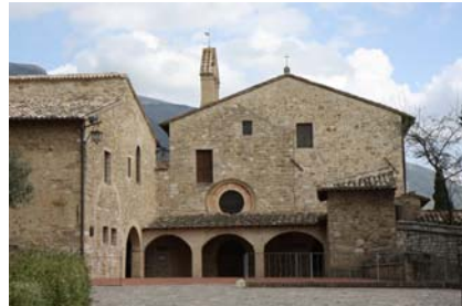
Assise : basilique de Saint-François, crucifix et église de Saint-Damien

En terminant, je tiens à remercier les frères de la Maison Générale et l'équipe de la SIR pour leur bonté et leur dévouement. Leur accueil nous a permis de vivre un temps privilégié de ressourcement spirituel et de rencontres fraternelles. Merci beaucoup à vous tous qui m'avez permis de vivre ce beau et bon moment ainsi qu'au Conseil Général qui croit au bien fondé de cette session. Que notre Seigneur vous comble de ses bénédictions!