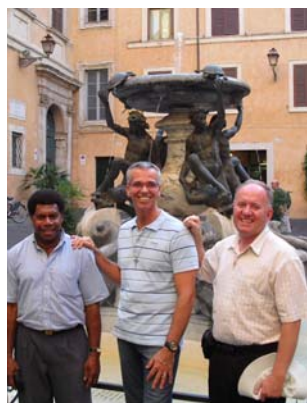
Avec des confrères dans la ville de Rome : fontaine des tortues et sur le bord du Tibre.

J'ai beaucoup apprécié les 4 thèmes présentés par les intervenants. Le premier exercice fut de revoir notre Règle de Vie. Je résumerais ce long moment par la phrase suivante : ma vie dans l'Institut des Frères du Sacré-Cœur est pour m'aider à réaliser le rêve de Dieu . Ce rêve qui veut que nous partagions notre avoir, notre savoir et notre temps avec ceux et celles qui sont sur notre chemin. Ce rêve qui veut que nous soyons sensibles les uns envers les autres. Ce rêve qui veut que nous discernions ensemble le projet de Dieu dans notre monde. Ce rêve qui veut que nous soyons des témoins de son Amour. D'où l'importance chaque jour de la relecture de notre journée pour voir l'action de Dieu et la réalisation de ce Rêve parmi nous.