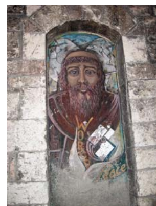
Fresque, ville d'Assise.

La deuxième activité consistait, à l'aide d'une documentation et de petits exercices intéressants, de découvrir, d'appivoiser et de prier avec les Icônes. J'aurais souhaité qu'on élabore davantage sur ce contenu, mais en parlant avec des amis(es) et confrères, plusieurs m'ont dit qu'ils avaient des livres sur le sujet dans leur bibliothèque. Donc, c'est à poursuivre pour ma part.