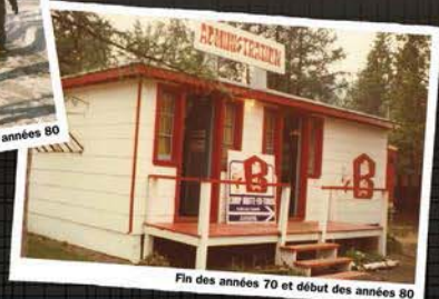
Fin des années 70 et début des années 80