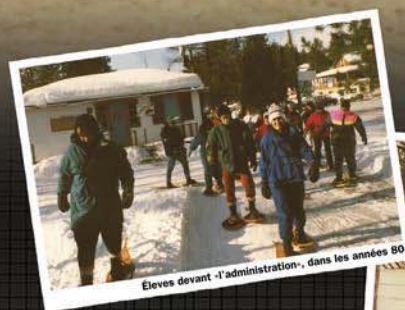
Elevés devant «l'administration», dans les années 80